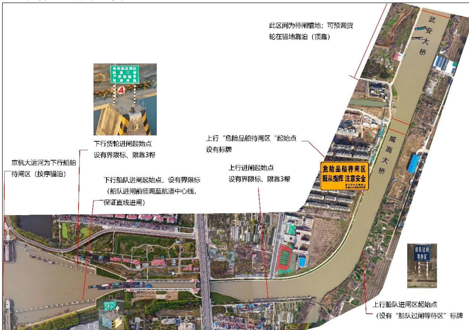
附图 2 停泊区总体布置图