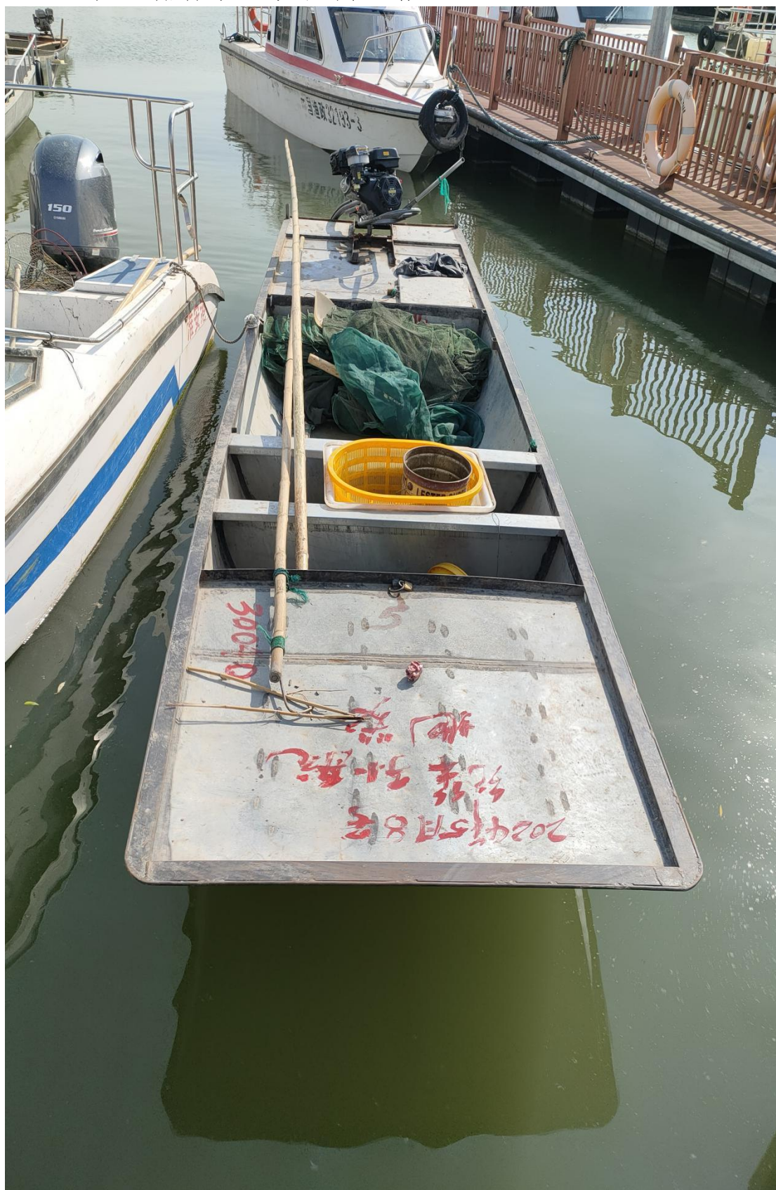
涉案船舶及渔具照片

2. 2024年5月8日在洪泽湖盱眙县鲍集镇鲍集水域查获的涉渔“三无”船舶及渔具照片1张