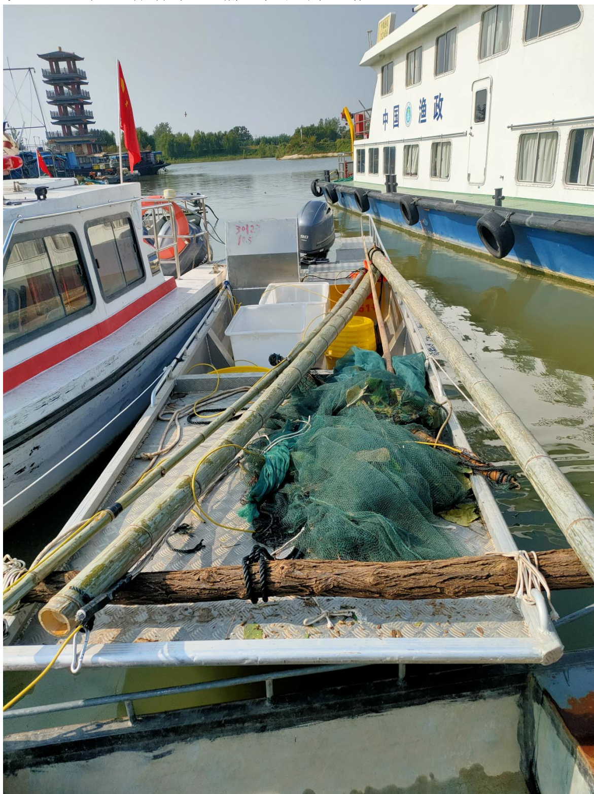
涉案船舶及电捕工具照片

14. 2024年10月5日在洪泽湖泗洪县半城镇祖楼水域查获的涉渔“三无”船舶及电捕工具照片1张