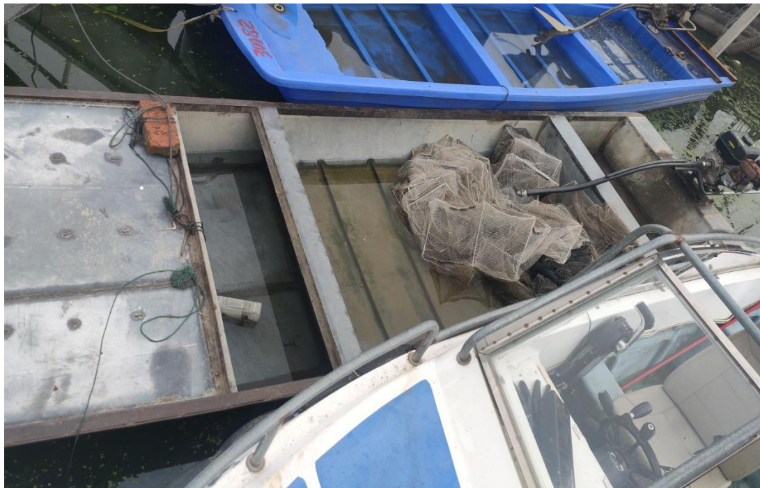
涉案船舶及渔具照片

6. 2024年7月12日在洪泽湖盱眙县鲍集镇水厂附近查获的涉渔“三无”船舶及渔具照片1张