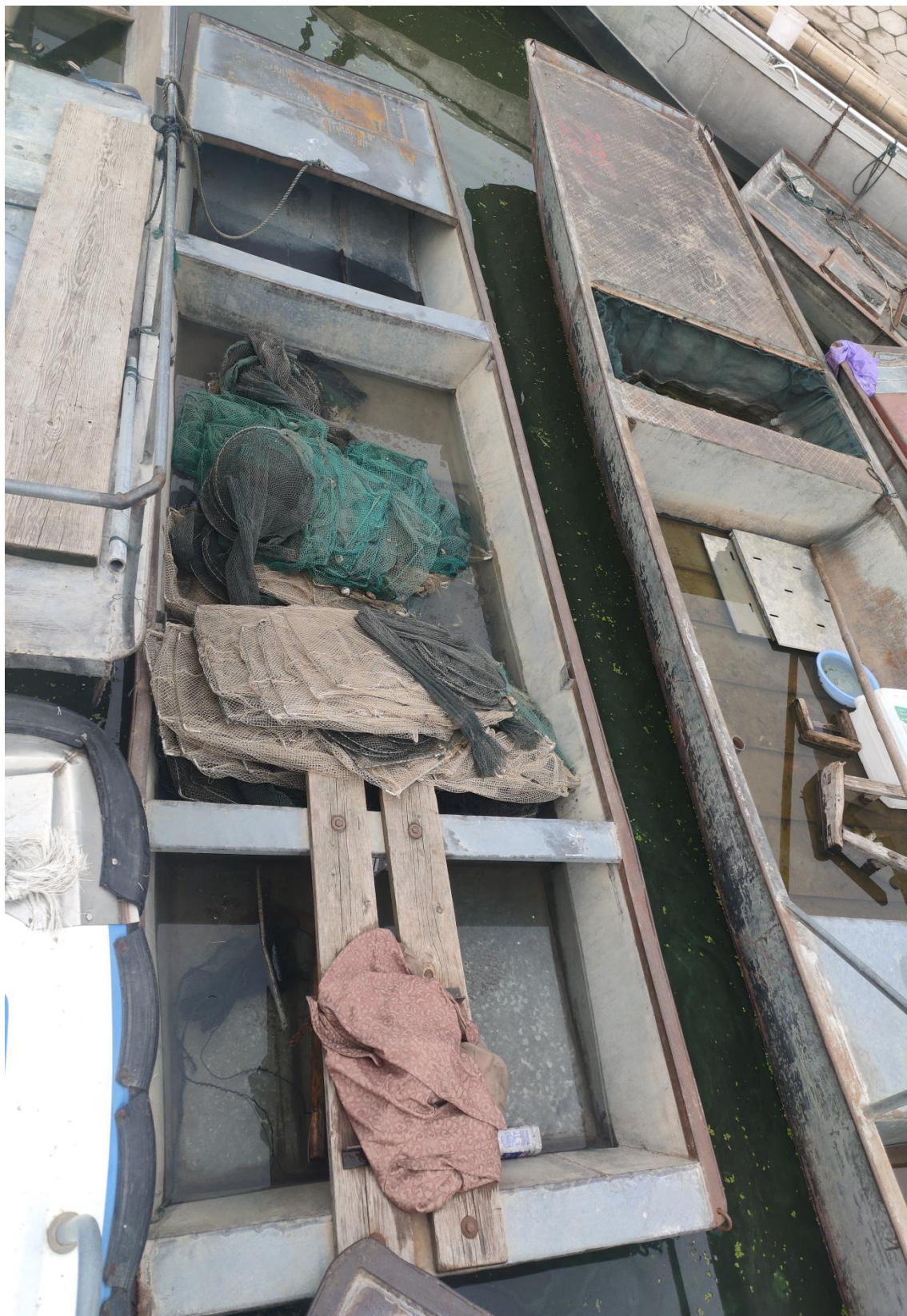
涉案船舶及渔具照片

5. 2024年7月11日在洪泽湖泗洪县临淮镇临淮水域查获的涉渔“三无”船舶及渔具照片1张